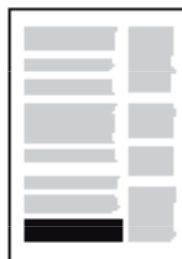
banner, två spalter