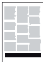
banner, tre spalter